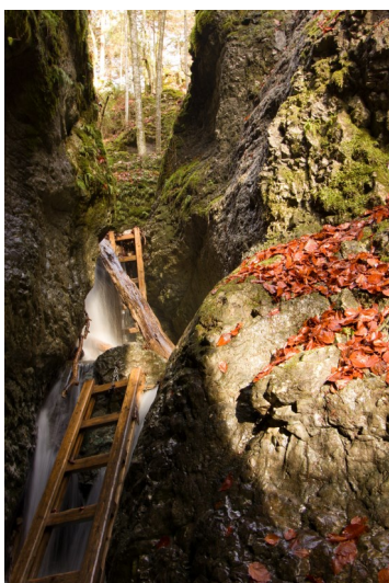
1.miesto Naša príroda: Čertova roklna na jeseň