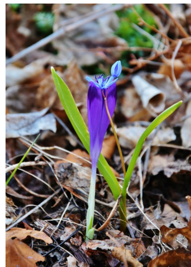
3.miesto Naša príroda: Objatie kvetov na Muráni / Miroslav Pôbiš